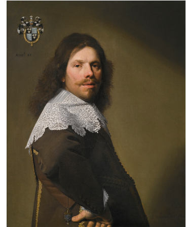
1643 | Cornelis de Glarges de Montigny (Johannes Cornelisz Verspronck fecit)

1.8.C.2.1.3.3.1 - Corneille de GLARGES de MONTIGNY 9 , °12 juillet 1599 (formellement reconnu lors de la signature du contrat de mariage de ses parents, le 25 septembre 1600), † Haarlem 10 avril 1683, éc., seigneur de Hélesmes, nommé en 1633 résident des Etats-Généraux de la République des Provinces-Unies à Calais, x La Haye 1633 Sarah Parret (ou Parre, Parr), °10 juin 1611, † Haarlem 2 juillet 1681, anglaise (fille de Pieter Parret et de Gijsberta Suyderbeek ou van Suyerbeek, d'une branche de la famille de Glarges, connue en Angleterre sous le nom de Clarges, qui reçoit le titre de baronnet le 30 octobre 1674, et s'est éteinte le 17 février 1854). Armes : burelé d'argent, et d'azur ; au franc-canton de quatre cornes d'or. Cimier : la tête de bélier du franc-canton). Dont onze enfants, e.a. [VDAA1862] [AACG1975] [NHA]